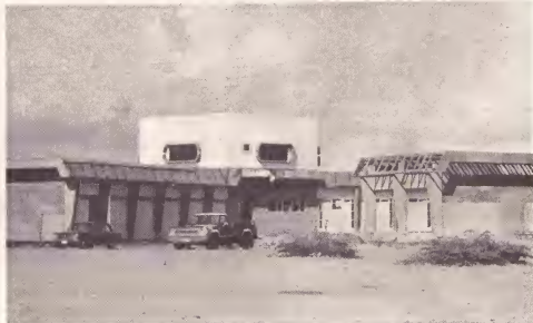
Pronto e pueblo di San Nicolas lo haya su promer centro medico cu lo bin cla na Juni di e aña aki. E centro aki lo costa casi 1 milyon y mei florin, incluyendo construccion, muebles y aparatonan.